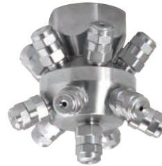
3" NPT 或 BSPT (F)