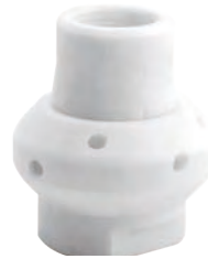
1/2" 到 3" NPT 或 BSPT