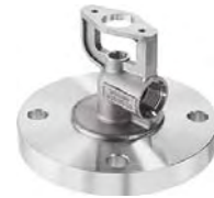
光滑式密封面法兰