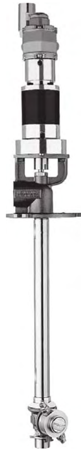
1" NPT 或 BSPT (F)