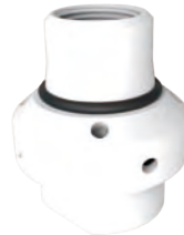
1/2" 到 1" NPT 或 BSPT 可拆除 O 形圈使喷雾环可轻松地 从喷嘴主体上拆除